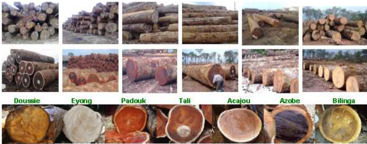
Doussie Eyong Padouk Tali Acajou Azobe Bilinga