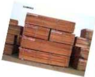
TIAMA Entandrophragma songoense