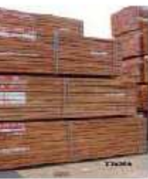
IROKO Milicia excelsa Milicia regia